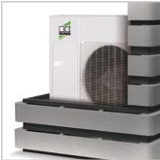
Schallreduktion von bis zu 15 dB(A)